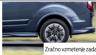
Zračno vzmetenje zadaj