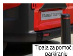
Tipala za pomoč pri parkiranju