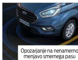
Opozarjanje na nenamerno menjavo smernega pasu