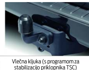
Vlečna kljuka (s programom za stabilizacijo priklopnika TSC)