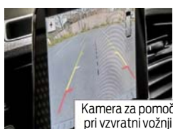
Kamera za pomoč pri vzvratni vožnji