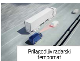
Prilagodljiv radarski tempomat