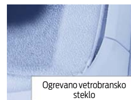
Ogrevano vetrobransko steklo