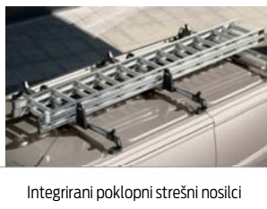
Integrirani poklopni strešni nosilci