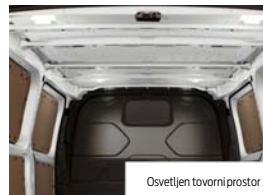
Osvetljen tovorni prostor