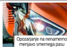
Opozarjanje na nenamerno menjavo smernega pasu