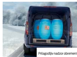
Prilagodljiv nadzor obremenitve