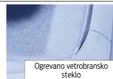
Ogrevano vetrobransko steklo