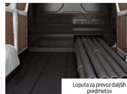
Loputa za prevoz daljših predmetov