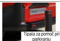
Tipala za pomoč pri parkiranju