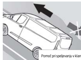
Pomoč pri speljevanju v klanec

Voznikov in sovoznikov senčnik z osvet. ogledalom