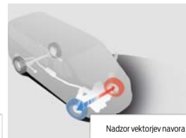
Nadzor vektorjev navora