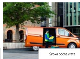
Široka bočna vrata