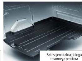
Zatesnjena talna obloga tovernega prostora