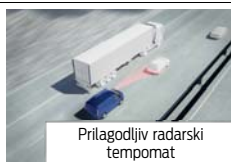
Prilagodljiv radarski tempomat