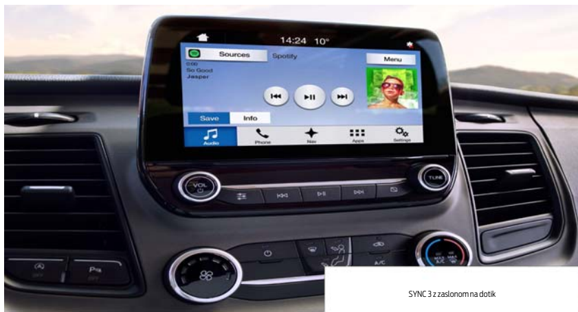
SYNC 3 z zaslonom na dotik